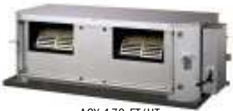
ACU 170 FT/UT