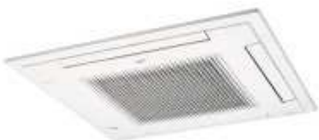
AUY 71/80/100/125/140 F/FT/U/UT/Ui