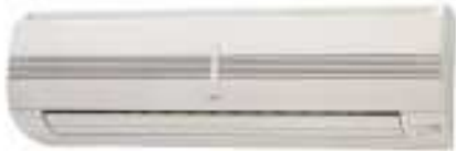
ASY 20/25/35/40 F/U