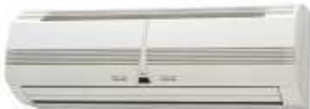
ASY 25/35 UA