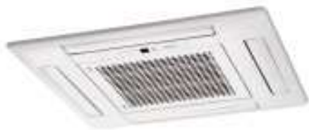
AUY 35/40/50 F/U/Ui