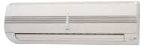
ASY 20/25/35 Uif

* Las unidades ASY40UIF-LA3 y ASY50UIF-LA3 sólo combinan con las unidades exteriores AOY50UI3F y AOY71UI3F. 3.3.5.5 ** Las unidades ASY50UIF y ASY71UIF, no pueden combinarse con las unidades exteriores AOY50UI3F y AOY71UI3F