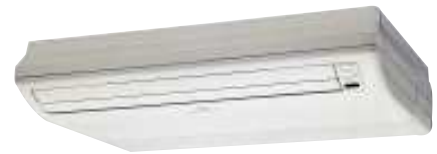
ABY 40/50/71 Uif