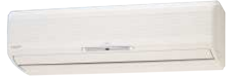
ASY 50/71 Uif