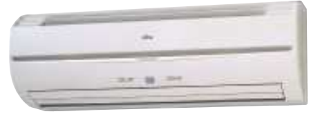
ASY 40/50 Uif-LA3