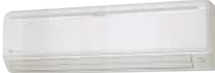
ASY 71/80 Ui (LC)