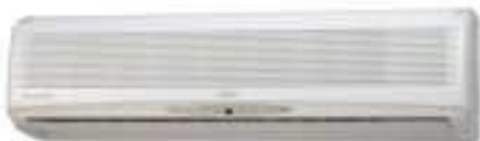
ASY 71/80F/U ASY 50UB/FB