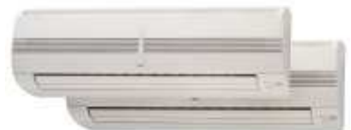
ASY 9/12/12 F/U