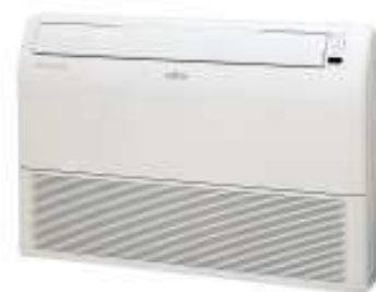
ABY 50/71 F/U/Ui (montaje suelo)