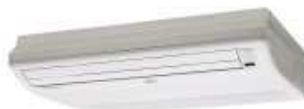
ABY 50/71 F/U/Ui (montaje techo)