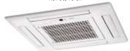
AUY 35/40/50 Uif