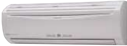
ASY 25/35Ui PC