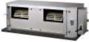
ACU 125 H / 140 Ui