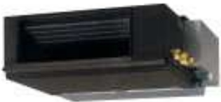
ACU 25/35/40/50 F/U